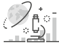
Pētniecības un attīstības ārpakalpojumi