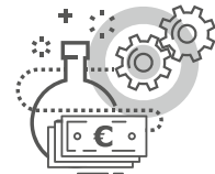
Iekārtu amortizācijas izmaksas eksperimentālām izstrādēm